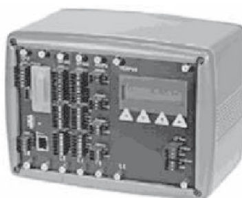
G4-RM DIN Rail Mount

Toutes les données indiquées peuvent être modifiées sans préavis. Toutes les mesures indiquées sont exprimées en millimètres (mm).