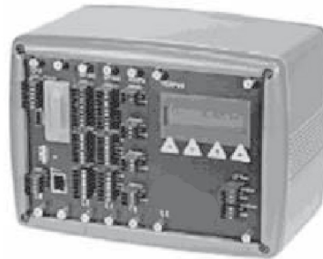
G4-RM DIN Rail Mount